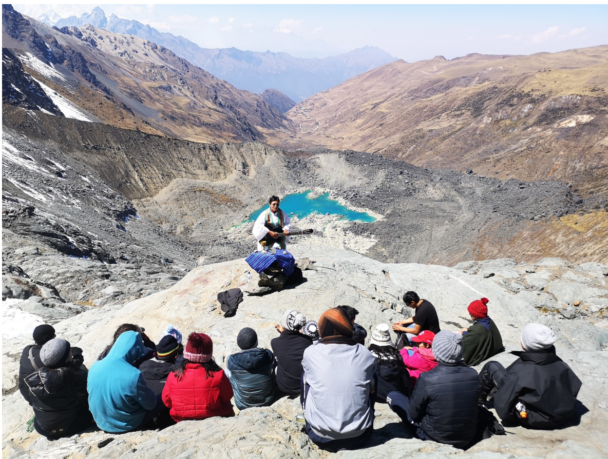
Experiencias de verano. Quillabamba Perú.

elizbarrutietako misioak misiones diocesanas vascas