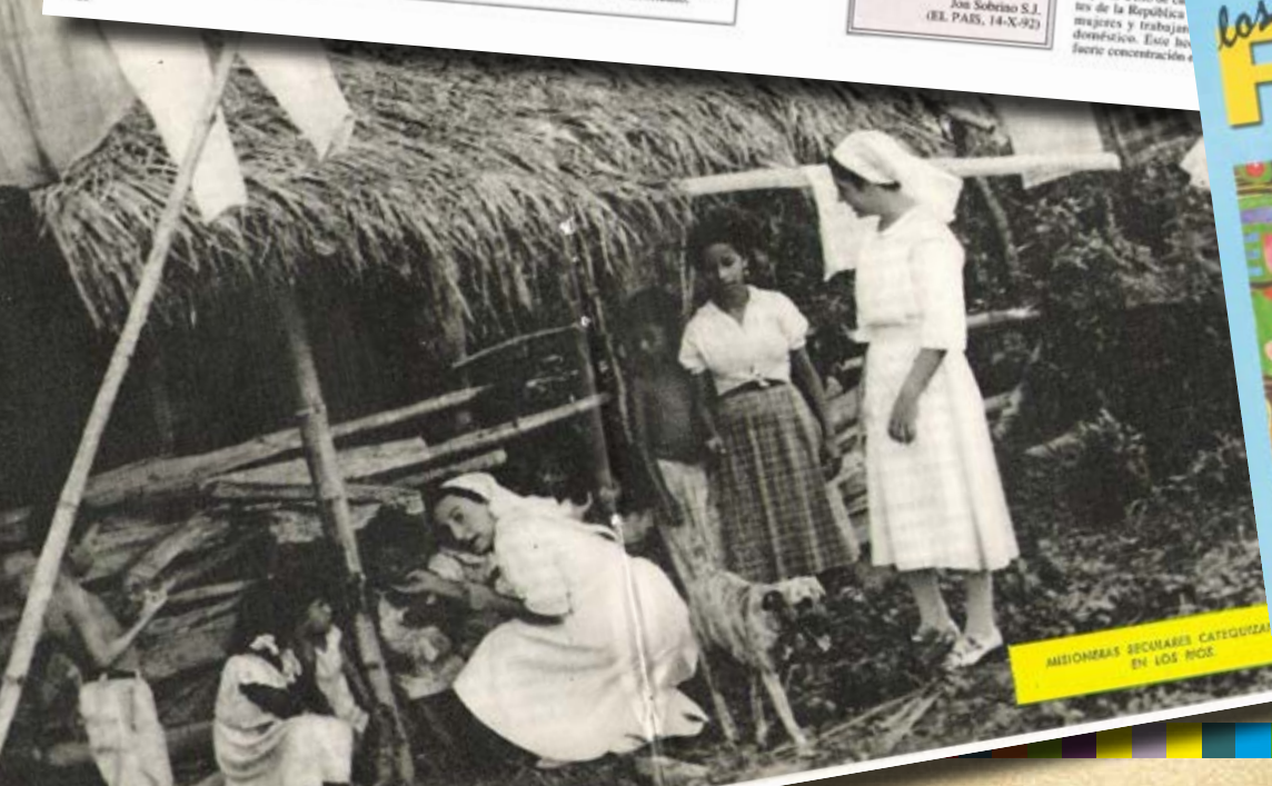
MISIONERAS SECUMARES CATEGORIAS EN LOS RIOS