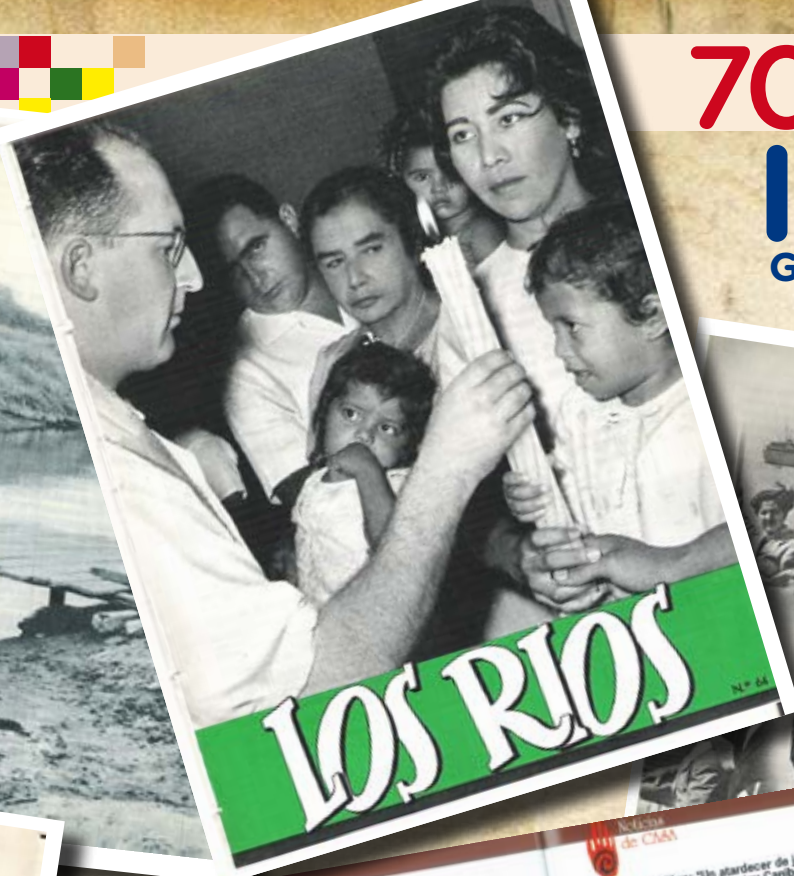
«Tres Misioneros Evangelistas Dicen mas, misioneros de Santandrea en el «Río del Pacifico» el día 21 de marzo, rumbo a Los Rios»