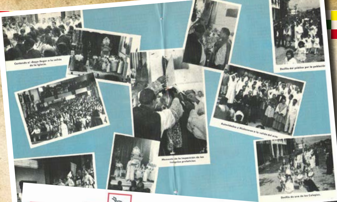
Contando el «Bajo-fuego» a la salida de la iglesia.