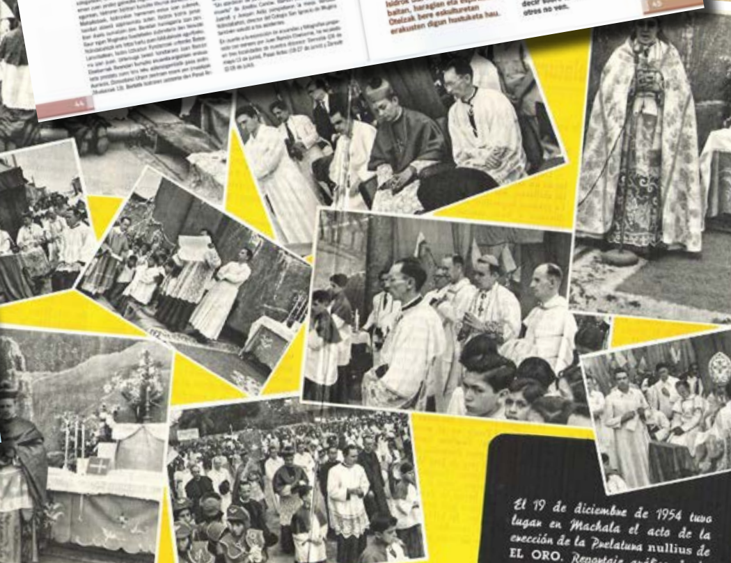
El 19 de diciembre de 1954 tuvo lugar en Machala el acto de la erección de la Prelatura nullius de EL ORO. Reportaje gráfico de la ceremonia