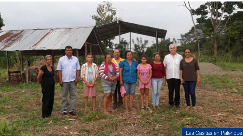
Las Casitas en Palenque

Ekudorren, hiru gauza nabarmentzen dituzte Euskal Misiolari Taldearen tankera ebanjelizatzailean: behartsuen aldeko lehentasunezko aukera; Oinarrizko Eliz Elkarteen prestakuntza eta akonpainamendua eta talde pastoralgintza. Medellinen sortutako hiru irizpide dira eta geure egin genituen