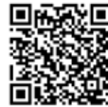
SÍNODO DE LA AMAZONÍA

A pesar de que a lo largo de este mes se concentrarán de forma especial las programaciones en torno al MME y al Sínodo, no debería ser ésta una iniciativa puntual, sino de largo recorrido, además de una buena ocasión para ampliar el perímetro de nuestra visión y acercarnos a otras realidades, mirándonos un poco menos a nosotros mismos y un poco más a los demás.