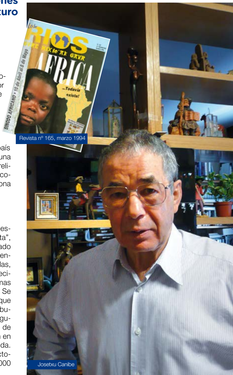
Revista nº 165, marzo 1994